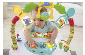
赤ちゃんの目の前に広がる8つのおもちゃ