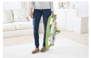
折りたためてコンパクトに！

「ジャンパルー」は、首がすわった赤ちゃんがよちよち歩きができるようになるまで、「安心して冒険ができる特別なスペースを」というコンセプトのもとにフィッシャープライスで開発・商品化された遊具兼育児用品で、赤ちゃんは安心・安全にジャンプ遊びをすることができます。欧米を中心にたくさんのママ・パパに愛用されています。ジャンプ遊びは赤ちゃんの筋力の発達を促してくれ、運動能力を高める手助けをしてくれるといわれています。また、昼間に「ジャンパルー」で遊ぶことにより活発に体を動かすため、夜には安眠を促す効果があります。フィッシャープライスでは、2007年に「ジャンパルー」のロングヒット商品「レインフォレスト・ジャンパルー」を日本に導入。2015年、新たに、コンパクトにたためるタイプの「レインフォレスト・コンパクト・ジャンパルー」を日本で発売します。