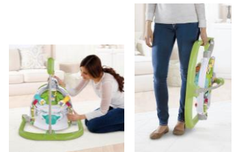
簡単にたためて、持ち運び・収納に便利！