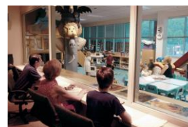
マジックミラー越しに赤ちゃんの反応をチェックします。