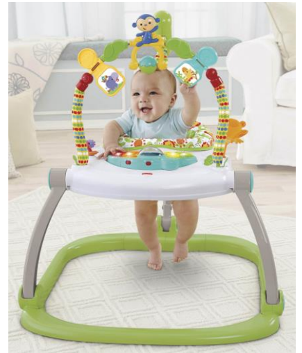
フィッシャープライス 「レインフォレスト・コンパクト・ジャンパルー」

「ジャンパルー」は、歩行器とは違い移動する心配もないため、安心して赤ちゃんを遊ばせることができます。また、赤ちゃんが座るシートの高さを4段階で調整できるので、赤ちゃんの成長に合わせて使うことができます。シート部分は洗濯できるので、常に清潔に使用できます。