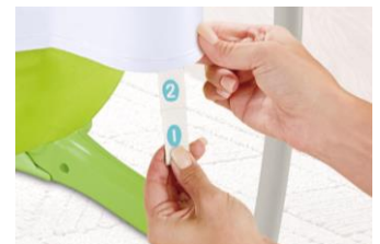
4段階にシートの高さを調整できます