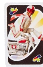
ワイルド・デューク・カブーン