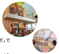
ニューヨーク州 イーストオーローラ

フィッシャープライスは60年以上おもちゃ研究を「プレイラボ」で真の遊びの専門家であるお子さまと一緒に続けてきました。お子さまと一緒に作るおもちゃには夢中になれるヒントがいっぱい。五感わくわく、楽しさいっぱいの遊びが今日も生まれています。