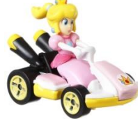
ピーチ/ スタンダード・カート