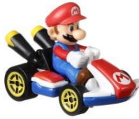
マリオ/ スタンダード・カート

商 品 名 : Marioカート アソート メーカー希望小売価格 : 各700円(税抜) 発 売 日 : 2019年6月末より順次発売 サ イ ズ ( c m ) : W13.9×D3.5×H16.5 対 象 年 齢 : 3歳以上