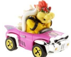
クッパ/バッドワゴン