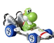
ヨッシー/Bダッシュカー