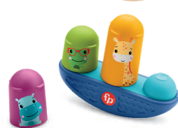
のせて!バランス! シーソーボード 楽しくバランス感覚を養い、 サイズ感や形を学べます。

プレイラボの専門知識を 活かして作られたお子さま の成長に合わせたおもちゃ セット