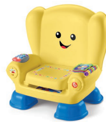
スマートステージ・バイリンガル・チェア トイ・インサイダー/ ワーキングマザーズベスト賞