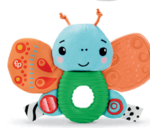
さわって!かみかみ! ちょうちょ 視覚と触覚を刺激。羽が曲がため になっています。

プレイラボの専門知識を 活かして作られたお子さま の成長に合わせたおもちゃ セット