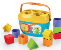
はじめてのブロック (レインフォレスト) オープンハイム・トイ・ポートフォリオ ブルー・チップ賞