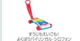
すうじもえいごも！ よくばりバイリンガル・シロフォン