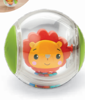
ころころ!キャッチ! ライオンボール 転がして追いかけて。 ビーズの音も楽しい!