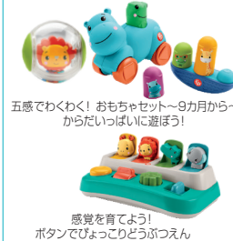
五感でわくわく！おもちゃセット～9ヵ月から～ からだいっぱい遊びぼう！