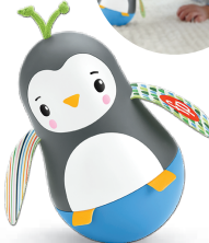
ゆらゆら!ころん! おきあがりペンギン ゆれるものをつかんで 体幹を鍛えます