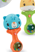
にぎって!ふって! どうぶつラトル 視覚・聴覚を刺激。羽が曲がため からだの発達もサポート!