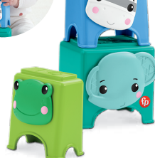
重ねて!しまって! どうぶつブロック 積んだり、倒したり! 器用な手先を育てます