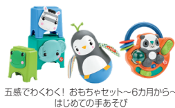
五感でわくわく！おもちゃセット～6ヵ月から～ はじめての手あそび