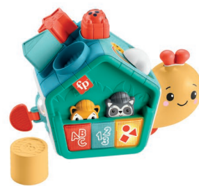
指あそびで発見！ すすむバイリンガル・でんでんむし ママリロコミ大賞