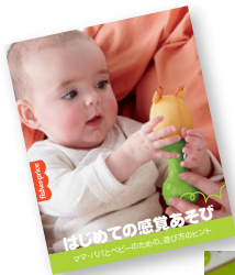
ママ・パパ用 「発達を促す遊び方のヒント」 付き