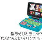
指あそびとおしゃべり わんわんのバイリンガル・パソコン