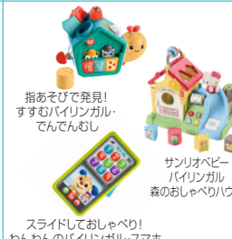
指あそびで発見！ すずむ！バイリンガル・ でんでんむし