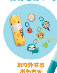
取り外せる おもちゃ