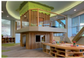
ニューヨーク州イーストオーロラ