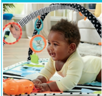
②はらばいて指遊び