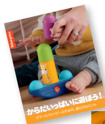
ママ・パパ用 「発達を促す遊び方のヒント」 付き