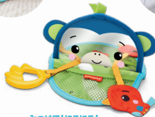
みつめて!にこにこ! モンキーミラー 視覚や聴覚を刺激し、 はらばいも促します