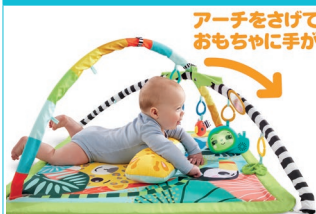
②はらばいて指遊び