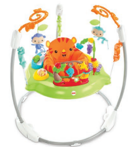
レインフォレスト・ジャンパルーII トイ・インサイダー/レッドブック