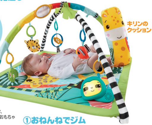
キリンの クッション