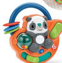
ライトアップ!メロディ! バンド 音楽やフレーズ! 楽しいしかけ付き

プレイラボの専門知識を 活かして作られたお子さま の成長に合わせたおもちゃ セット