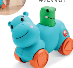
おして!おいかけっ! まて!カバさん カバさんを追うことで、 からだの発達を促します。