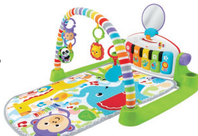
あんよでキック！ 4WAYバイリンガル・ピアノジム セクシィベビー・ロコミ大賞、MAMADAYS優秀賞