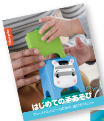
ママ・パパ用 「発達を促す遊び方のヒント」 付き